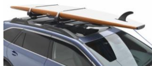
Support SUP/surf CHF 565