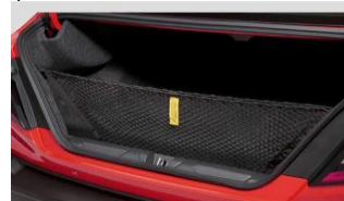
Filet à bagages CHF 75