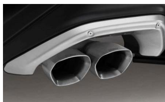
Enjoliveur d'échappement STI CHF 490