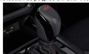
Levier de vitesses (GT) CHF 290