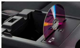
Lecteur CD CHF 635