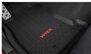
Tapsi de sol en caoutchouc CHF 195