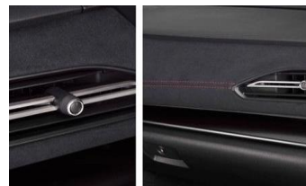
Tableau de bord Ultrasuede CHF 320