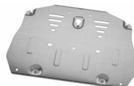
Protection du soubassement CHF 365