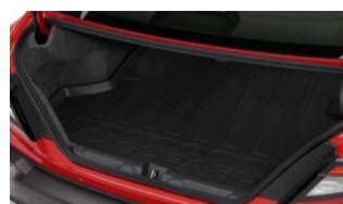
Tapis de coffre en caoutchouc CHF 125