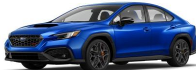
World Rally Blue Pearl