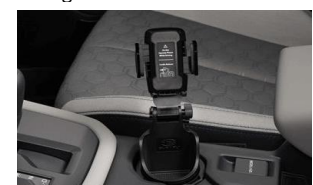
Support pour téléphone portable CHF 85