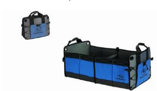
Organisateur de coffre CHF 125