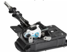
STI Short Shifter CHF 570