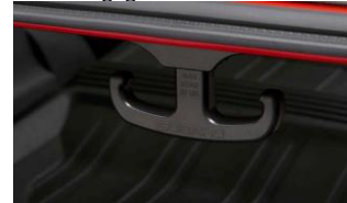
Crochet de coffre CHF 55