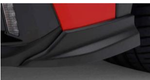
Kit Strake avant CHF 380