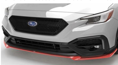
Lèvre de spoiler avant STI rouge CHF 790