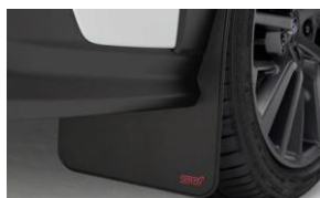
Bavettes STI CHF 225