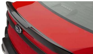
Lèvre de spoiler arrière CHF 935