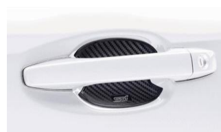
Protection de poignée STI CHF 110