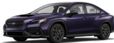
Galaxy Purple Pearl (seulement tS)