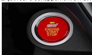
Bouton de démarrage STI CHF 350