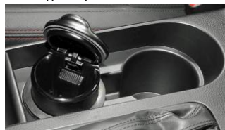
Cendrier pour porte-gobelet CHF 55