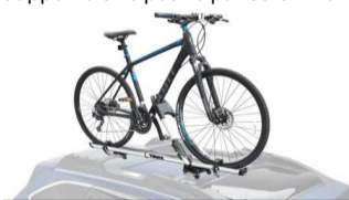
Porte-vélos simple Thule CHF 355