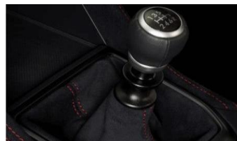
Lévier de vitesses Ultrasuede CHF 355