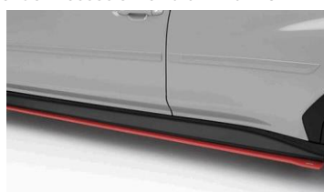
Bas de caisse STI rouge CHF 940