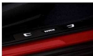
Seuils de porte éclairés CHF 380