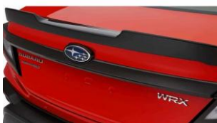
Baguette décorative en carbone CHF 450