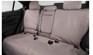
Housse de siège arrière CHF 385