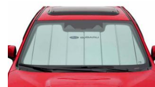
Pare-soleil CHF 115