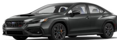
Magnetite Grey Metallic