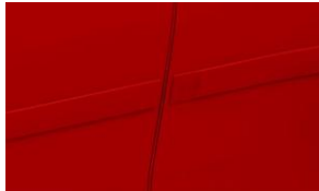
Protection des bords de porte CHF 230