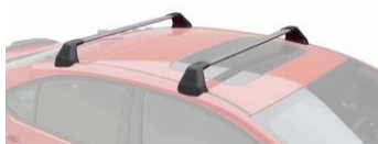
Support de base CHF 595