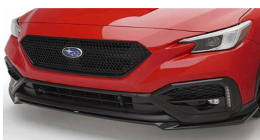
Lèvre de spoiler avant STI noire CHF 790