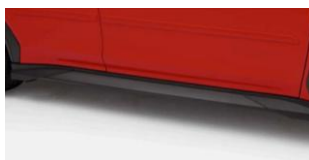
Kit Strake bas de caisse CHF 1 190