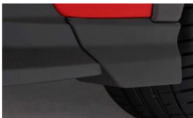
Garde-boue avant CHF 175