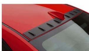
Générateur de vortex CHF 150