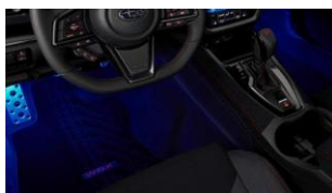
Éclairage du plancher CHF 270