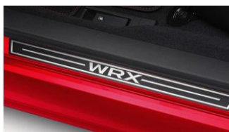
Seuils de porte CHF 195