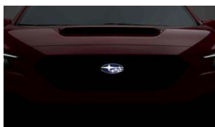
Emblème de calandre à LED CHF 570