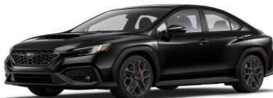
Crystal Black Silica