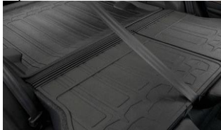
Protections de dossiers arrière CHF 125