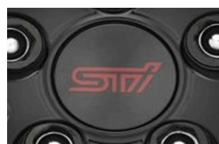
Capuchons de moyeu STI CHF 50