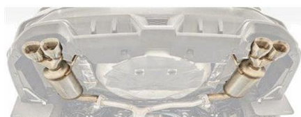
Silencieux STI Performance CHF 2100