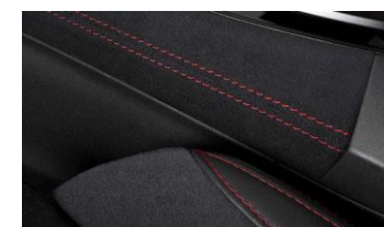
Console centrale Ultrasuede CHF 360