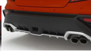
Diffuseur pare-chocs arrière CHF 1075