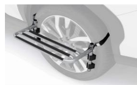
Marchepied CHF 310