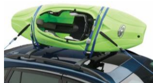
Support pour canoë CHF 380