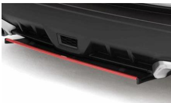
STI unterer Heckspoiler rot CHF 610