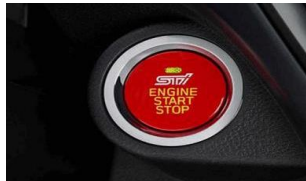
STI Startknopf CHF 350