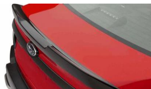
Heckspoilerlippe CHF 935