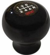
STI Duracon Schaltknauf CHF 160