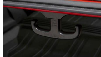
Kofferraumhaken CHF 55