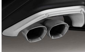
STI Auspuffblende CHF 490