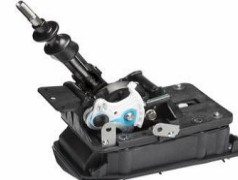
STI Schaltwegverkürzung CHF 570