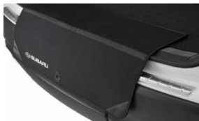
Stossfängerschutz CHF 125