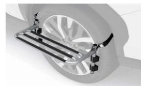
Radstufe CHF 310