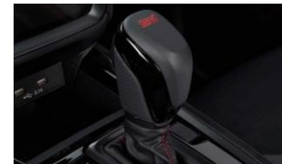
STI Schaltknauf (GT) CHF 290