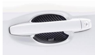
STI Türgriffschutz CHF 110