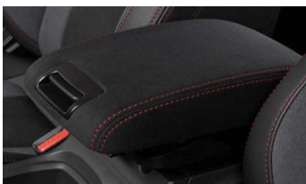
Ultrasuede Armlehne CHF 490