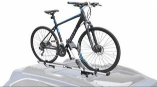
Thule Einzelfahrradträger CHF 355