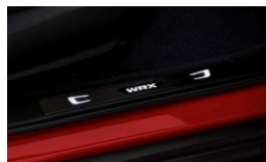
Einstiegsleisten beleuchtet CHF 380