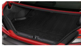
Laderaummatte CHF 125