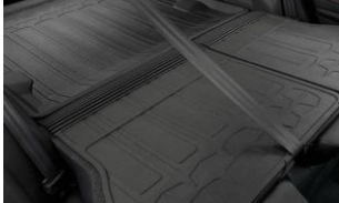
Rücksitzlehnschutz CHF 125