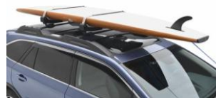
SUP/Surf Aufsatz CHF 565