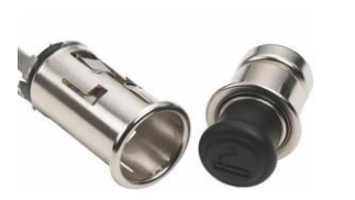
Zigarettenanzünder CHF 75