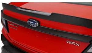
Karbonierleiste hinten CHF 450