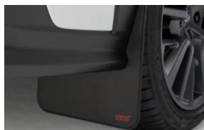
STI Mud Flaps CHF 225