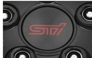
STI Nabendeckelsatz CHF 50