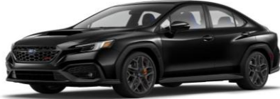
Crystal Black Silica