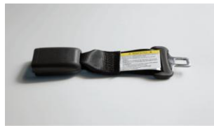
Sicherheitsgurtverlängerung CHF 220