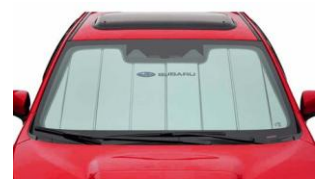
Sonnenschutz CHF 115