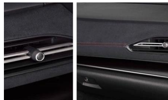
Ultrasuede Armaturenbrett CHF 320