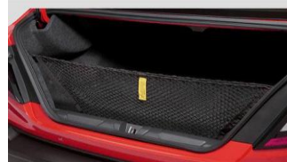
Gepäcknetz CHF 75