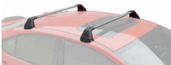
Grundträger CHF 595