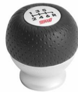
STI Aluminiumschaltknauf CHF 410