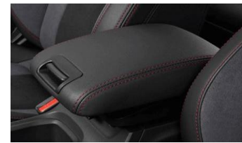
Soft-Touch Armlehne CHF 385