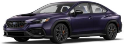
Galaxy Purple Pearl (nur tS)