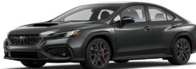
Magnetite Grey Metallic