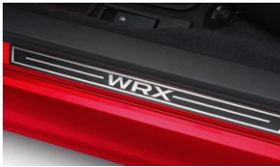
Einstiegsleisten CHF 195