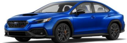
World Rally Blue Pearl