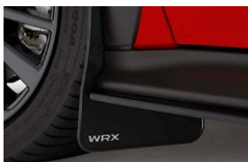
Mud Flaps CHF 190