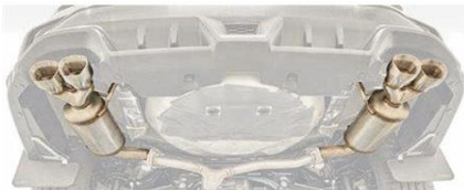
STI Performance Schalldämpfer CHF 2100