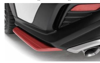
STI untere Seitenspoiler rot CHF 940