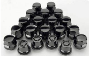
Radmutternsatz schwarz CHF 230