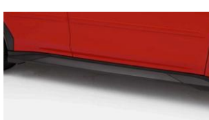
Strake Kit Schweller CHF 190