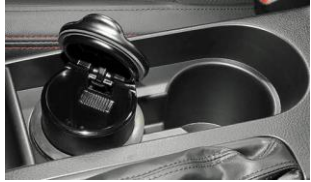
Aschenbecher für Getränkehalter CHF 55