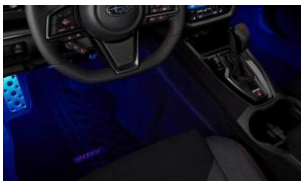
Fussraumbelichtung CHF 270