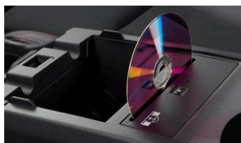
CD-Player CHF 635