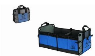
Kofferraum Organizer CHF 125