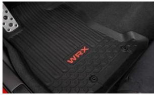
Gummimatten Set CHF 195