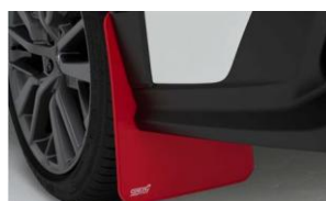
STI Mud Flaps (rot) CHF 225