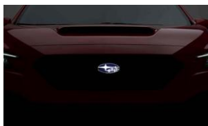
LED-Kühlergrill-Emblem CHF 570