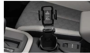
Handyhalter für Getränkehalter CHF 85