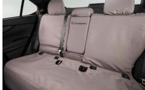
Sitzbezug Rückbank CHF 385