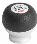
STI pomello del cambio in alluminio CHF 410