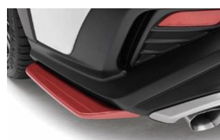
STI spoiler laterali inferiori rossi CHF 940