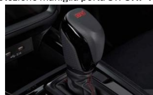
STI pomello del cambio (GT) CHF 290