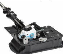
STI Short Shifter CHF 570