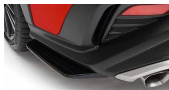
STI spoiler laterali inferiori neri CHF 940