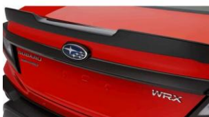
Listello decorativo (carbonio) CHF 450