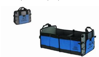
Organizer per bagagliaio CHF 125