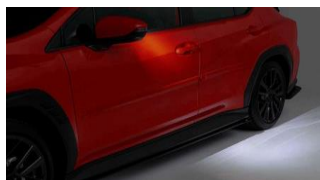
Specchietti esterni con oscuramento automatico con illuminazione perimetrale CHF 390