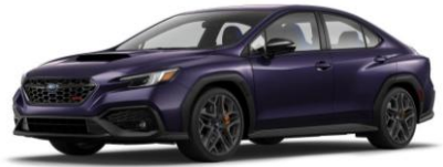
Galaxy Purple Pearl (solo tS)