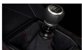
Copri cambio in Ultrasuede CHF 355