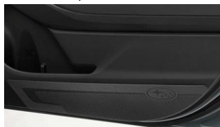
Listelli protettivi per porte CHF 155