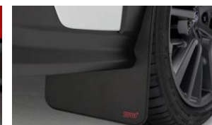
Parafanghi STI CHF 225