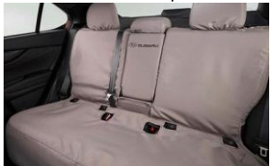
Coprisedili posteriori CHF 385