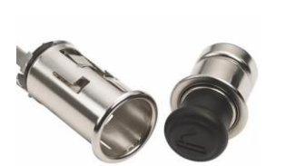
Accendisigari CHF 75