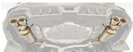
Marmitta STI Performance CHF 2100