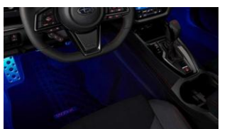
Illuminazione vano piedi CHF 270