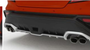
Diffusore paraurti CHF 1075