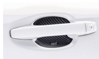
Protezione maniglia porta STI CHF 110