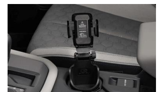
Supporto per cellulare CHF 85