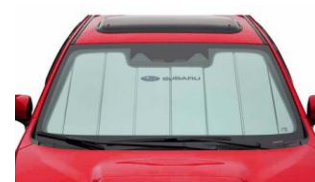
Parasole CHF 115