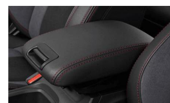
Bracciolo Soft-Touch CHF 385