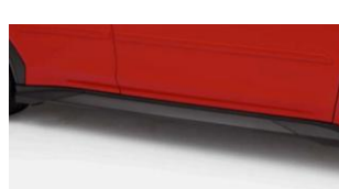
Kit Strake minigonne CHF 190