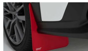
Parafanghi STI (rossi) CHF 225