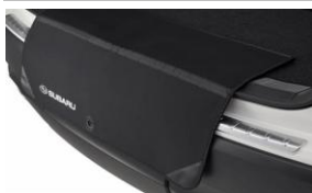
Protezione paraurti CHF 125