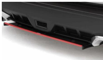
STI spoiler posteriore inferiore rosso CHF 610