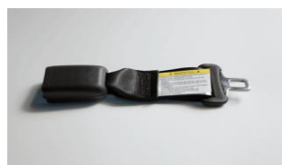
Prolunga cintura di sicurezza CHF 220