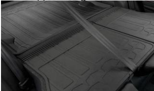
Protezione dello schienale posteriore CHF 125