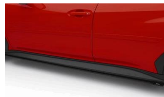
STI minigonne laterali nere CHF 940