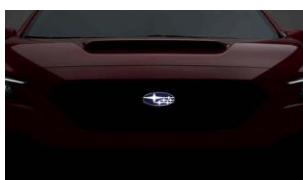
Emblema griglia radiatore a LED CHF 570