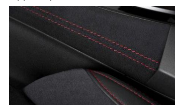
Console centrale in ultrasuede CHF 360