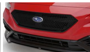
Griglia del radiatore sportiva CHF 635