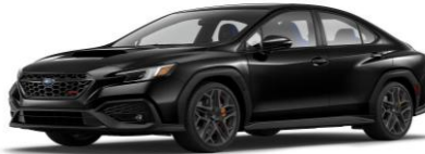
Crystal Black Silica