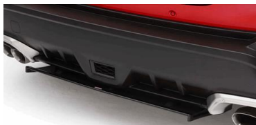
STI spoiler posteriore inferiore nero CHF 610