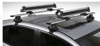
Portasci fino a 6 paia di sci CHF 510