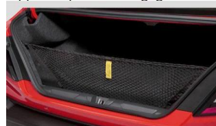
Rete portaoggetti CHF 75