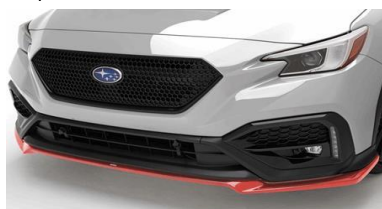
STI spoiler anteriore rosso CHF 790