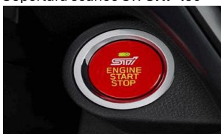
Pulsante di avviamento STI CHF 350