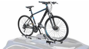
Portabici singolo Thule CHF 355