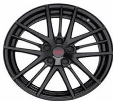
Set di cerchi in lega STI da 18" CHF 2950