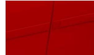
Protezione bordi porte (colore dell'auto) CHF 230