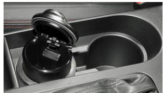
Posacenere per portabicchieri CHF 55