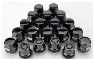
Set di dadi ruota neri CHF 230