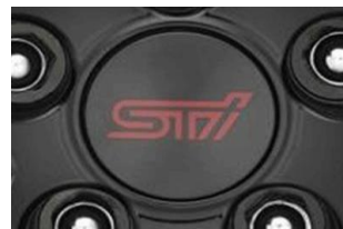
Set di coprimozzi STI CHF 50