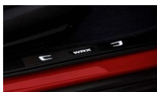
Listelli sottoporta illuminati CHF 380