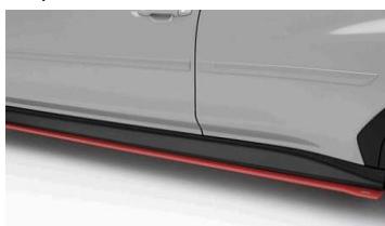
STI minigonne laterali rosse CHF 940