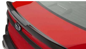
Spoiler posteriore CHF 935