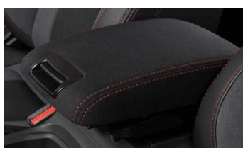
Bracciolo in ultrasuede CHF 490