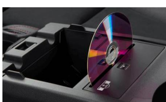
Lettore CD CHF 635