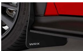
Parafanghi CHF 190