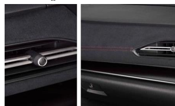
Cruscotto in ultrasuede CHF 320