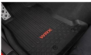
Set di tappetini in gomma CHF 195