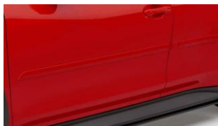
Listelli protettivi (colore dell'auto) CHF 630