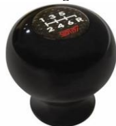
STI pomello del cambio Duracon CHF 160