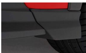
Parafango anteriore CHF 175