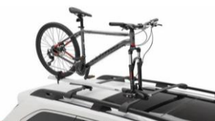
Portabici Thule, montaggio su forcella incl. lucchetto CHF 355